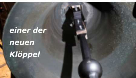
einer der neuen Klöppel

In diesem Frühjahr wurden die Kirchenglocken von St. Johannes Nepomuk mit neuer Glockentechnik ausgestattet. Die Steuerung der Antriebe, die vier Klöppel und das Schlagwerk wurden durch neue Technik ersetzt. Dazu wurde die Steuerungstechnik mit Hauptuhr und Elektrik erneuert. Mit dieser neuen Technik und den neuen Klöppeln können unsere wertvollen Glocken