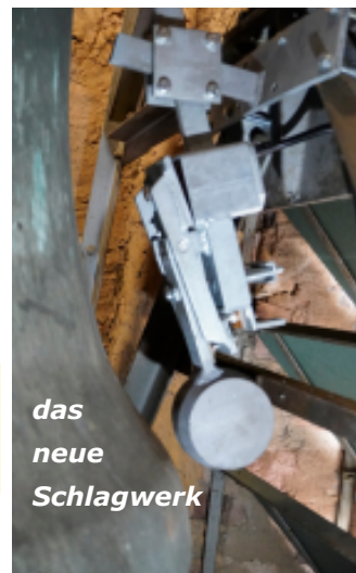
das neue Schlagwerk

Der Glockenexperte Niklas Grob aus Bieber schrieb: "Ich habe mir gerade mal das Sonntagseinläuten in Kassel angehört. Das klangliche Ergebnis ist wirklich hervorragend - bin absolut begeistert! Aus meiner Sicht ist die Sanierung sehr gut gelungen, ihr könnt wirklich stolz sein!"