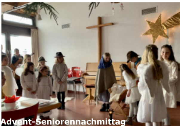
Impressionen vom Kasseler Advent-Seniorenachmittag