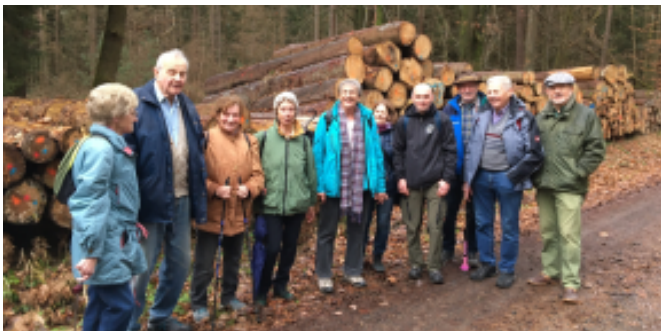
Winterwanderung zwischen den Jahren