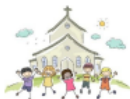
Kinderkirche St. Johannes Nepomuk Kassel