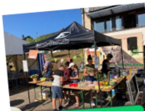
Crêpes und Cocktailstand am Pfarrfest