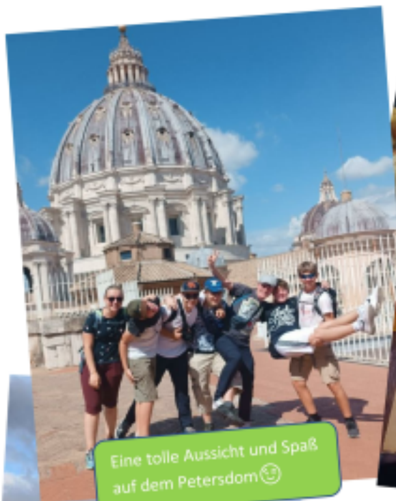
Eine tolle Aussicht und Spaß auf dem Petersdom 😊