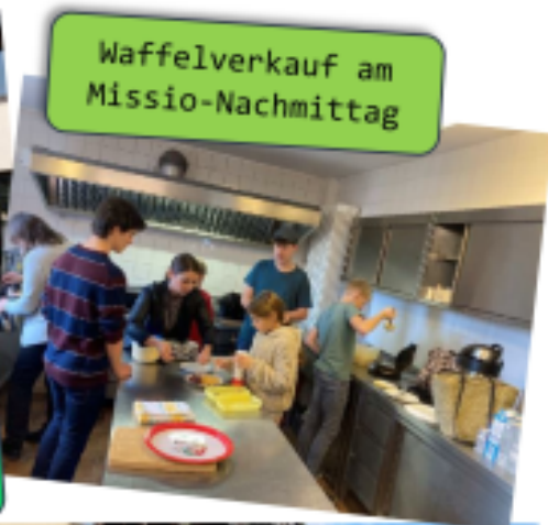
Waffelverkauf am Missio-Nachmittag