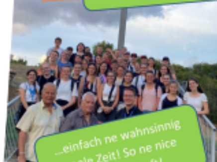
...einfach ne wahnsinnig coole Zeit! So ne nice Gemeinschaft!